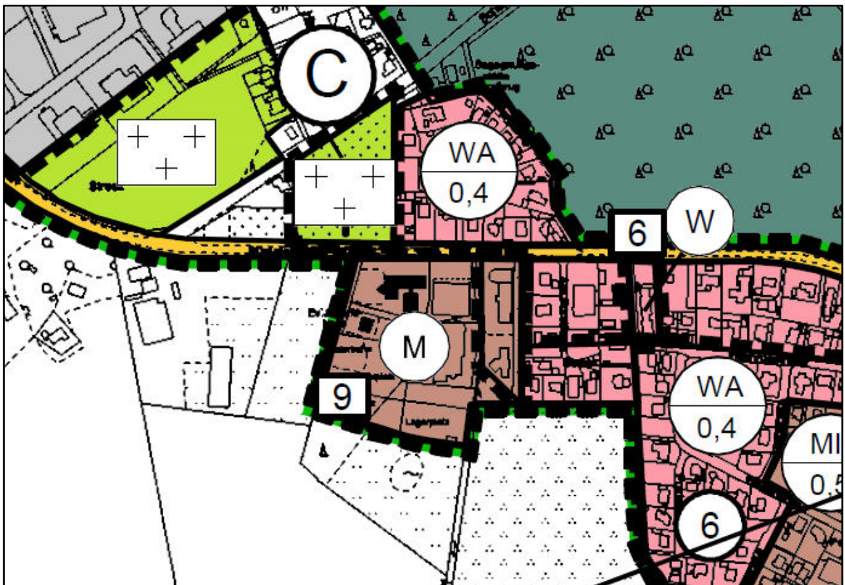
Abb.: Ausschnitt Flächennutzungsplan (ohne Maßstab)

Durch die Festsetzung von Mischgebietsflächen innerhalb des Geltungsbereiches des Bebauungsplans Nr. 43 ergaben sich Abweichungen von den Darstellungen des Flächennutzungsplanes. Da die Aufstellung des Bebauungsplans im beschleunigten Verfahren gem. § 13a BauGB durchgeführt wurde, war kein gesondertes Änderungsverfahren für den Flächennutzungsplan erforderlich, sondern der Flächennutzungsplan konnte in den abweichenden Bereichen im Wege der 9. Berichtigung mit der Darstellung von gemischten Bauflächen angepasst werden.