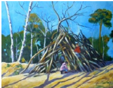
Foto: Ein repräsentatives Gemälde („Waldtag II“, entstanden bei einem Ausflug der Kita Alte Dorfschule...)

Den musikalischen Rahmen gestaltet der Sänger und Gitarrist Jörgen Lang.