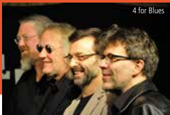
4 for Blues